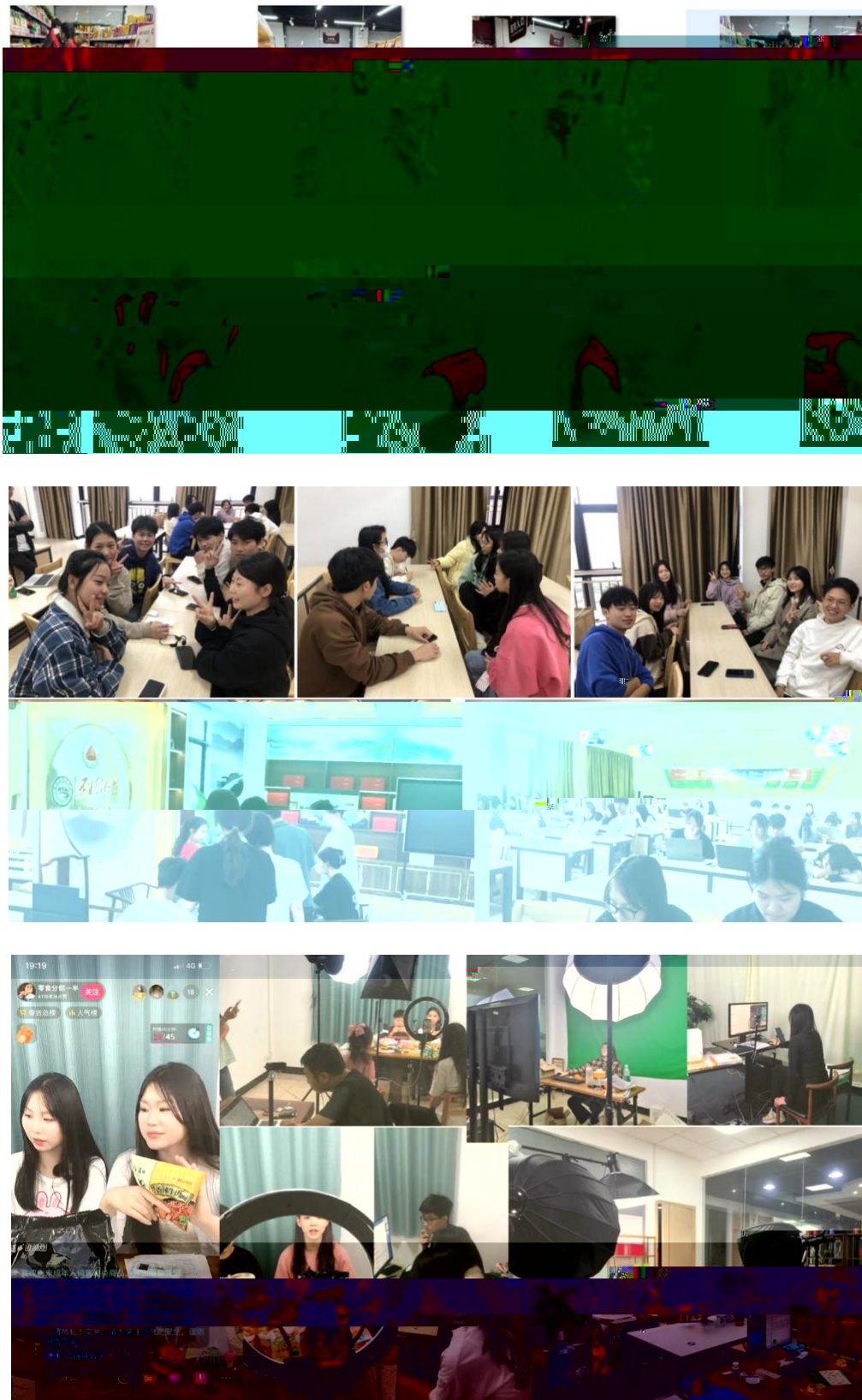
图 组织学生开展实习实训