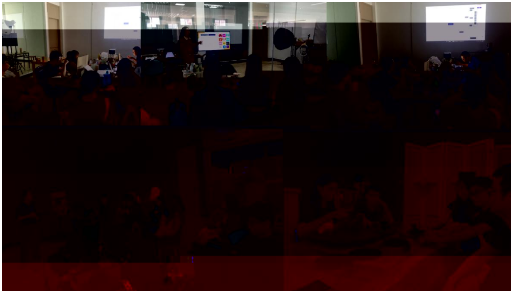
图 特邀企业专家来基地为学生进行专业培训

地 2023 地 ( 2), 供 宝贵的 。 过 的分 , 度 、 场变 , 对电 播 的 。 不 的 储备, 高 操 , 的 发 奠定 础。 措 合 的 度, 地 合 的 。