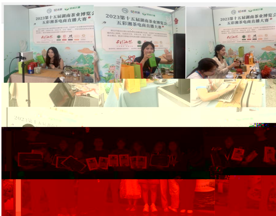
图 “湖南省第十五届茶博会” 电商直播比赛现场

播和方的，短 得的步。 队比 10多单、单， 包但不、等多个，的 和队得的高度。的 得不对公的，更对参 付出和的充分定。